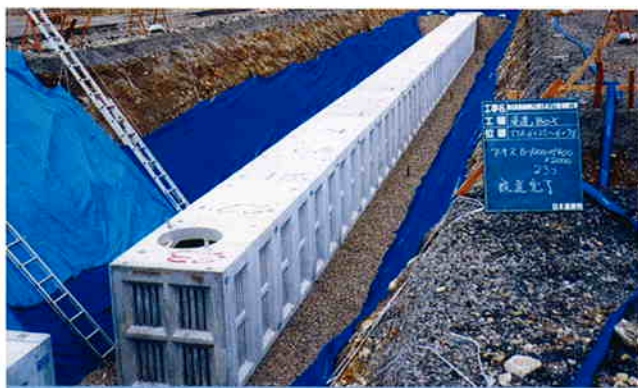
● 東名高速道路牧之原SA工事 (静岡県榛原郡)