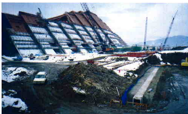
● オリンピック冬季大会スピードスケート会場(長野県長野市)