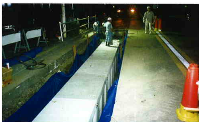
● 雨水流出抑制施設整備工事 (東京都新宿区)