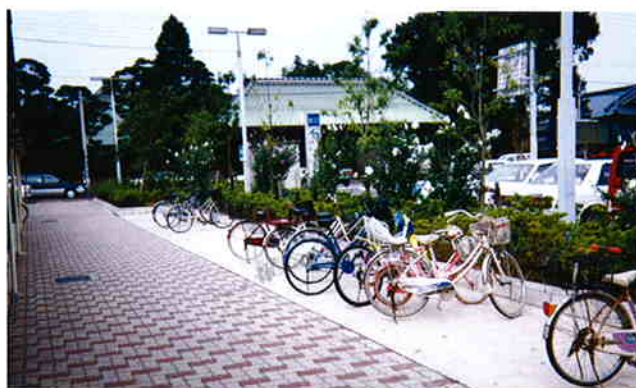
● イトーヨーカドー長沼店 (千葉県千葉市)